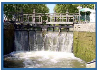
Scolaires et tout public